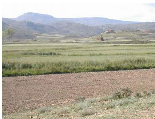
El molino de Anadón en 2003. El entorno de la masía de Yerna, con la Muela de Anadón al fondo en el camino tradicional entre Anadón y Huesa.