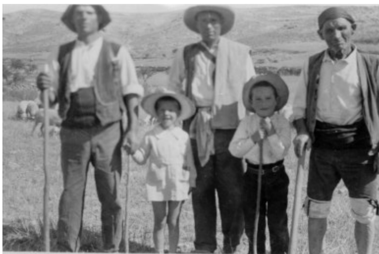
Ilustración 5: Pastores de Blesa a comienzos del siglo XX