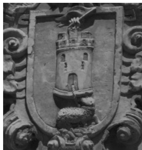
Ilustración 1: Escudo de los Latorre en la casa de la parra, en Huesa del Común. Véase que de la puerta sale un cordero atado.

concretos; pero al fin y al cabo sin competencia (con clientes asegurados más tarde o más temprano). Para el municipio significaba librarse de una tarea y salarios (cortante, pastores), cobrar unos derechos por adelantado y estar a salvo de la inflación de los precios durante el periodo de arriendo.